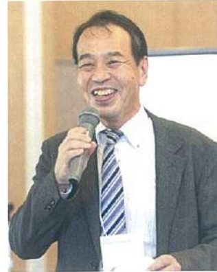
ファシリテーター