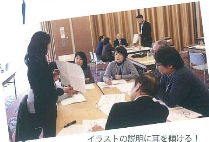
イラストの説明に耳を傾ける！